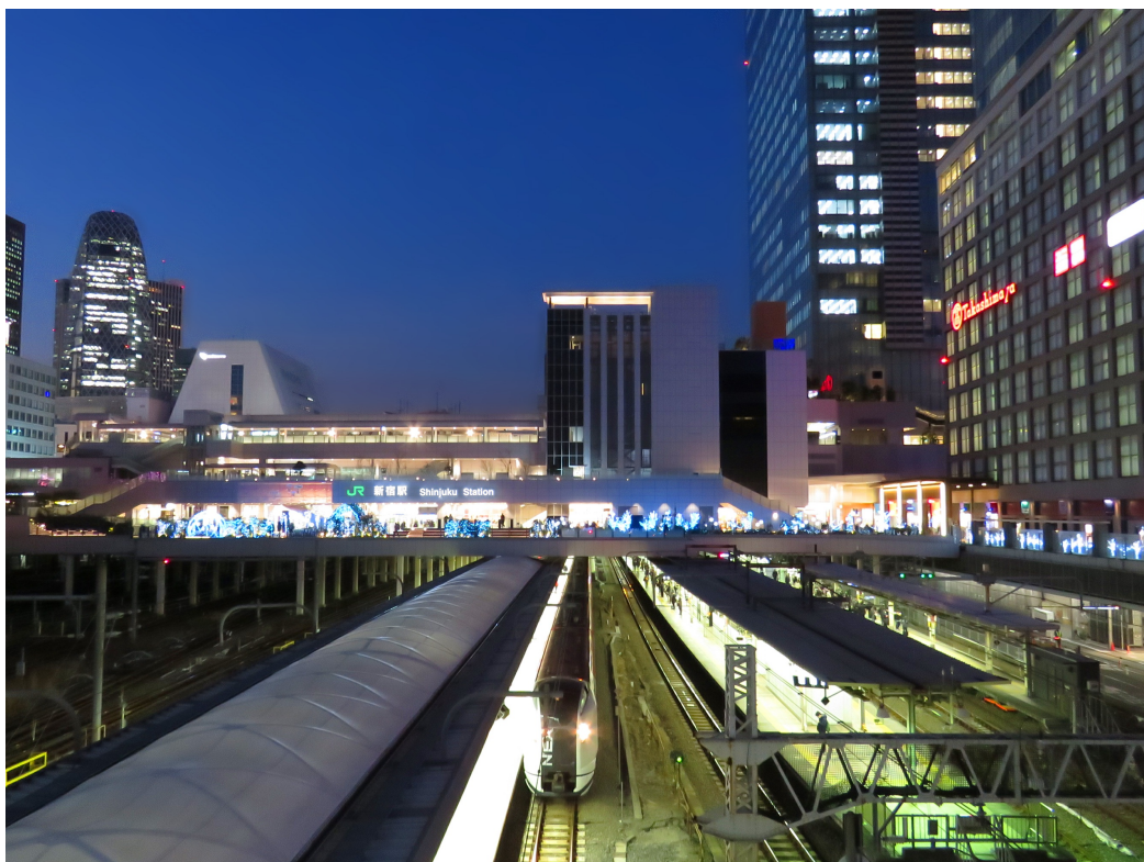
「個と調和」：14種類の発車ベルが単独で識別されつつも全体で調和される